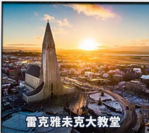
雷克雅未克大教堂